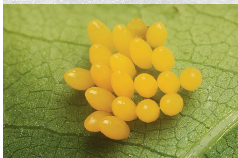
בחורף היא מחליטה להטיל ביצים - ביצי הכנימה