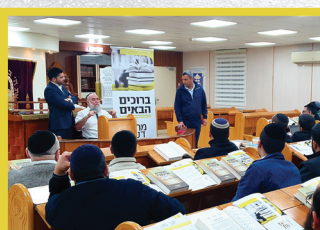
קורס כשרות לאברכים מטעם עיריית שדרות