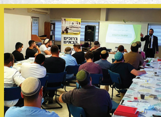
קורס סתם למתחזקים מטעם העירייה באילת