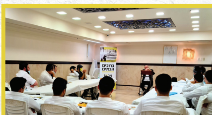
הרצאה בסניף י-ם של הרב שמואל בורנשטיין בנושא כשרות המלוונות