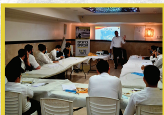
סדנת השתלמות מקצועית להשתלבות מהירה בעולם הפרנסה