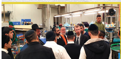
סיור קבוע לקורסי הכשרות במפעלים. בתמונה: במפעלי חסלט בדרום הארץ