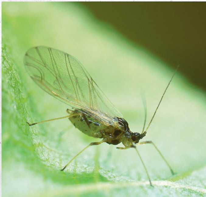
תחום מרתק - בדיקת חרקים במעבדה

שיושרצו לאתר מזון פנוי בקרבת מקום, מחמת סכנת הרעב המרחפת משריצות הכנימות 'המייסדות' וולדות בעלי כנפיים, הצעירות מתבגרות תוך ימים ספורים, פורשות כנף, מתרחקות ומתחילות בעסק 'יישוב העולם', כך יעברו הן מידי יום בשדות הירק וישריצו 'שגירה' אחת - ללא כנפיים בכל צמח, שם תקים את משפחתה לאלתר, תוך שבוע מעת הגעת הכנימות 'המכונפות' לשטח ניתן יהיה להכריז על הצלחת 'הכיבוש', אלו שהושרצו זה עתה יתחילו במלאכת 'יישוב העולם' אחר כשבוע אחד בלבד, לאור