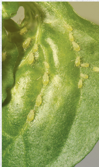
'אימת החקלאים' - עלים שניזוקו מהכנימות

מקבלי המידע על מחזור חיי הכנימה יופתעו כשיגלו שלה תכונה מיוחדת מאוד שאינה מצויה בשאר בעלי החיים, שהיא: שיבוט הוולדות. כנימת העלה תחליט מתי ואיך להוציא לעולם את וולדותיה,